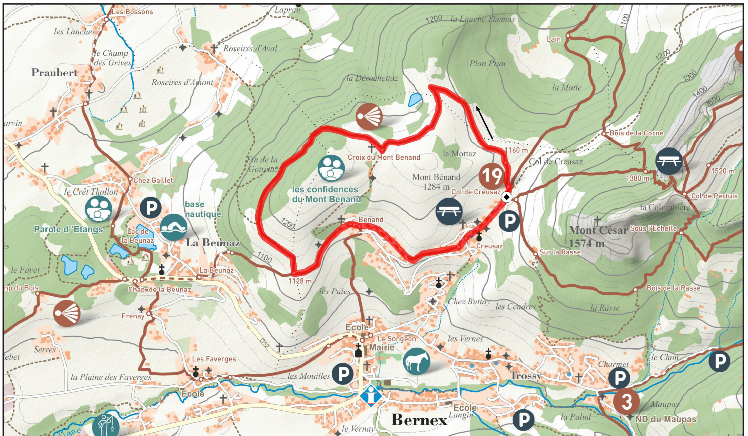
Extrait de la carte 1/33000 « 25 balades et randonnées au pays d'Évian » (3€)

Recommandations Avant votre départ, consultez la météo. Prévoir un équipement adapté : chaussures de marche, vêtements chauds et de pluie, quelques vivres, de l'eau, une trousse de première urgence. Ne pas surestimer ses capacités physiques.